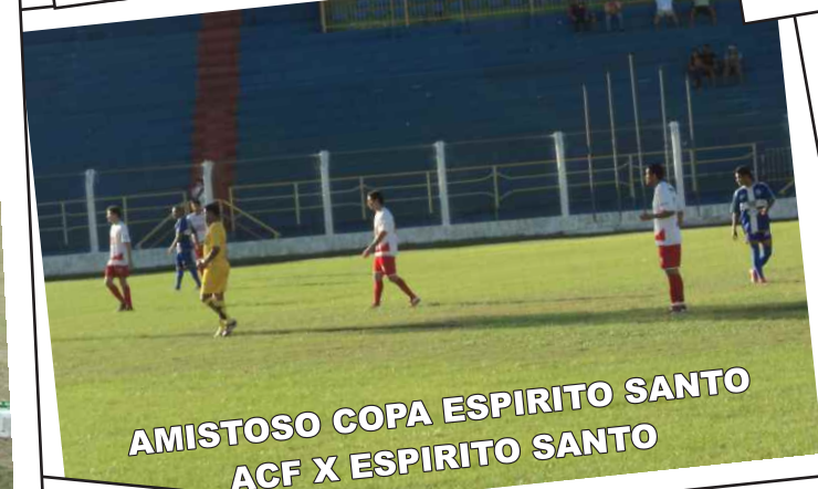
AMISTOSO COPA ESPIRITO SANTO ACF X ESPIRITO SANTO