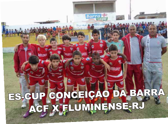
ES-CUP CONCEIÇÃO DA BARRA ACF X FLUMINENSE-RJ