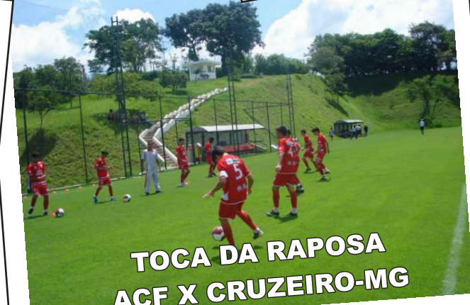
TOCA DA RAPOSA ACF X CRUZEIRO-MG