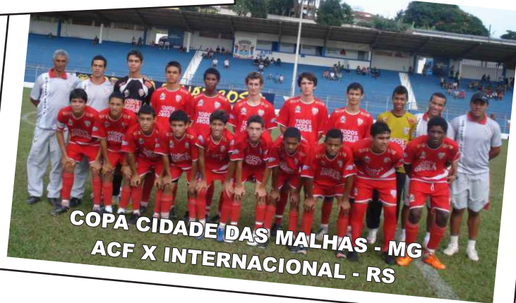
COPA CIDADE DAS MALHAS - MG ACF X INTERNACIONAL - RS