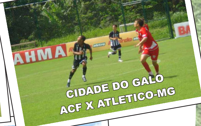
CIDADE DO GALO ACF X ATLETICO-MG