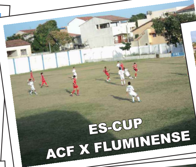
ES-CUP ACF X FLUMINENSE